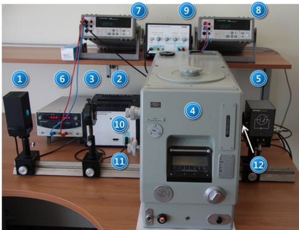
Zdjęcie 1. Stanowisko do wyznaczania stałej Plancka: 1 – lampa Hg-Cd; 2 – zasilacz lampy; 3 – soczewka; 4 – monochromator; 5 – fotokomórka Sb-Cs; 6 – zasilacz fotokomórki; 7, 8 – woltomierze; 9 – wzmacniacz; 10, 11 – pokrętki szerokości szczeliny oraz zmiany długości fali; 12 – przesłona.